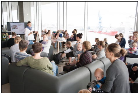
Abb. 3: Kurs zur Gesundheitsfürsorge für junge Familien in der Öffentlichen Bibliothek Dokkl in Aarhus.

Die überwiegenden Aktivitäten sollen Workshops, Vorträge, Filme, Diskussionen und verschiedene Kurse sein, die sich mit Angeboten zur Sprachverbesserungen über Förderung der Medienkompetenz bis hin zu Tango und Stricken beschäftigen (Abb. 3). Die Aktivitäten werden hauptsächlich am Bedarf der Benutzer orientiert. Das bedeutet, dass die kuratierte kulturelle Einrichtung verschwindet.