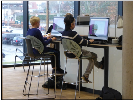
Abb. 1: Kinder an bereitgestellten Computern im Kulturhafen Gilleleje in Nordseeland.

2017 täglich durchschnittlich 97 Minuten für das Streaming von Filmen oder YouTube-Videos, 60 Minuten für soziale Medien, 54 Minuten für das Streaming von Radio, Podcasts oder Musik und 51 Minuten für Gaming aufgewendet haben (Danmarks Radio, 2018).